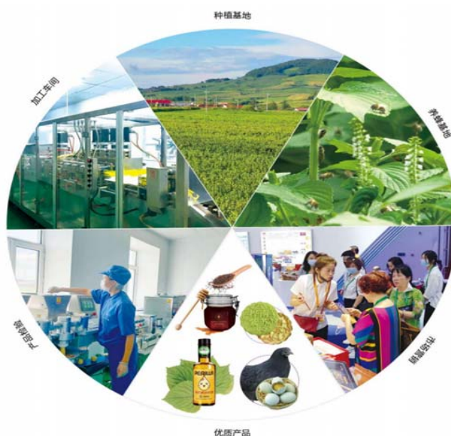
图 2-3 桦南县紫苏产业链近年来，举办了“中国·桦南紫苏节”等系列活动，宣传推广“紫津坊”“半山翁”“桦南仙紫”等产品品牌，“桦南紫苏”知名度和影响力显著提升。

示范区内紫苏种植基地条件好、规模大，基本形成集“科研-种植-加工-销售-物流-品牌”的全产业链条。拥有紫苏产品研发专利 2 项，建成紫苏标准化生产技术集成试验示范基地 1 个、省级现代农业科技园 1 个，现有大型紫苏收购企业 7 家，加工企业 5 家，紫苏原料加工能力达 3600 吨，加工转化率可达 45%，年可生产紫苏油 500 吨、紫苏蜂蜜 500 吨、紫苏鸡蛋 1000 万枚，精选紫苏籽 5000 吨。大力发展绿色有机地理标志产品，获得“桦南紫苏”国家地理标志 1 个、绿色有机产品标识 2 个，并通过了中国有、欧盟、美国、日本四个世界权威有机食品机构认证，以及国家食品安全管理体系认证、ISO9001 质量管理体系认证等 10 多项专业认证。2017 年，荣获第三届消费者最喜爱的黑龙江 100 种绿色食品第三名。