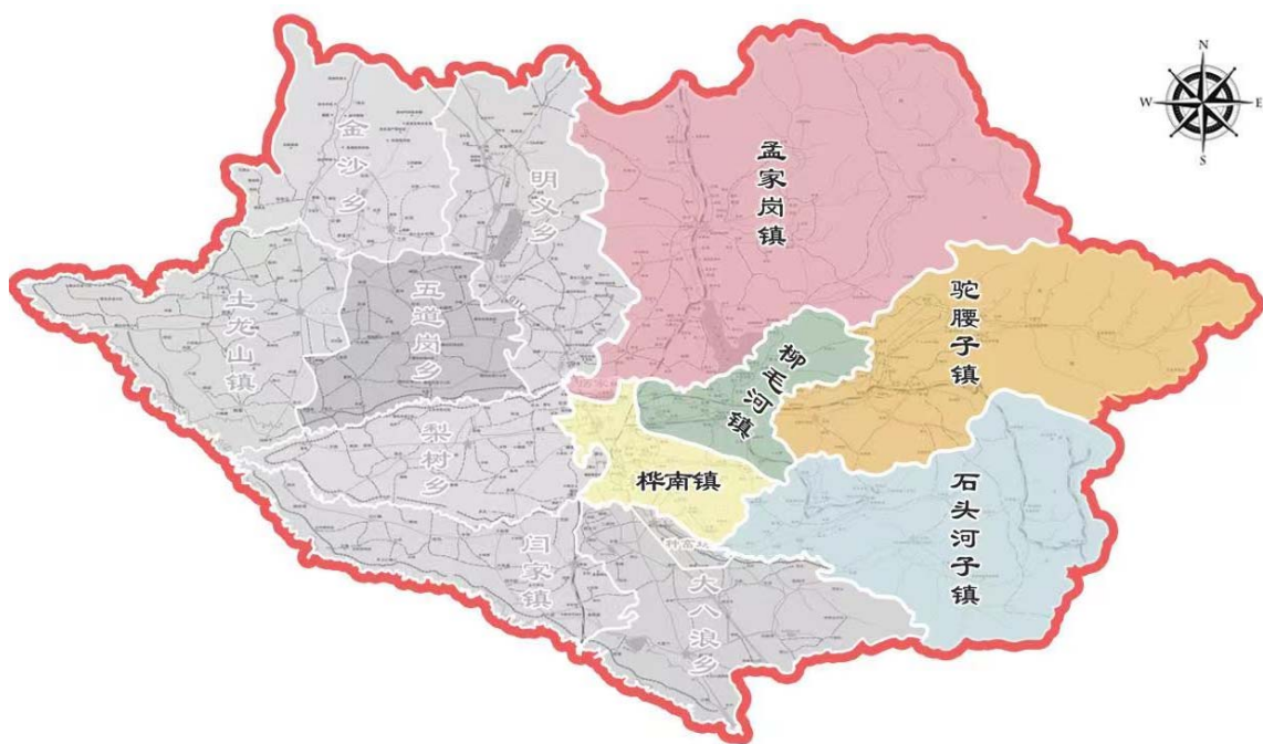
图 1-1 示范区范围图