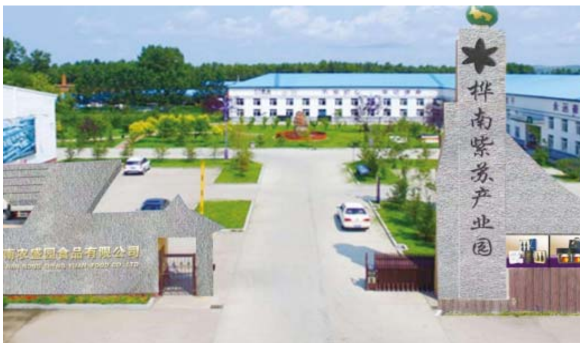
图 2-1 桦南紫苏产业园

产业发展情况。 示范区特色产业紫苏发展态势良好，成功打造桦南紫苏产业园。2021 年，示范区内紫苏种植基地达 8 万余亩，以缓坡林地种植为主，年产紫苏籽约 6500 吨、紫苏梗近万吨，是全国规模最大的紫苏种植基地。全区有紫苏加工企业 5 家，建有原料仓储库 15 个，冷藏保鲜库 4 个，风选、清洗等初加工设备 30 余台套，紫苏油生产线 8 条，紫苏油精炼加工生产线 2 条，紫苏籽加工能力达 3600 吨，紫苏梗达到 5000 吨，紫苏产业加工转化率可达 45%。农业经营管理不断完善，现有家庭农场 1803 个，其中省级以上家庭农场 14 家；农民专业合作社 206 个，其中省级以上农民专业合作社示范社 4 个，土地流转率达到 65%。